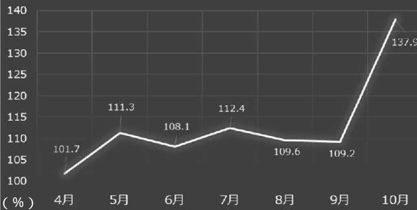
古紙・衣類の月別増加率（前年度比）

大阪市が収集した古紙・衣類の月別収集量（上図）と月別増加率（下図）です。皆さまのご協力のもと持ち去り行為の規制を実施した結果、平成29年の古紙・衣類の収集量は前年と比べて上半期（4月～9月）では、約9%の増、罰則規定を施行した10月においては、約38%の増となっています。