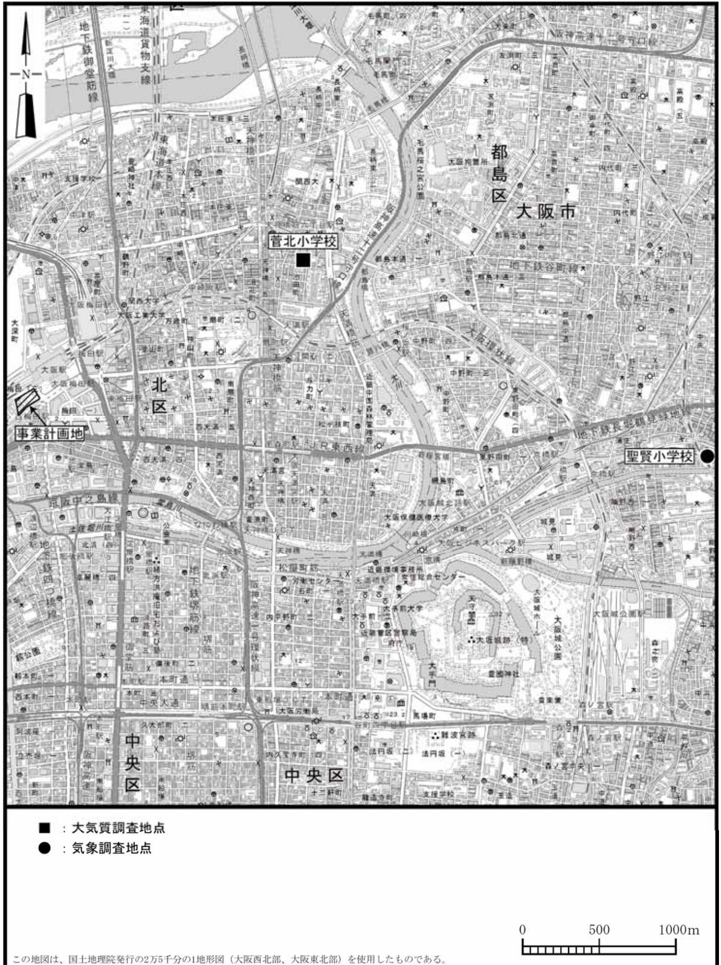
図 5-2-1 現況調査地点の位置