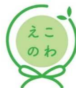
「えこのわ」ロゴマーク