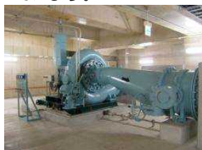
長居水力発電設備