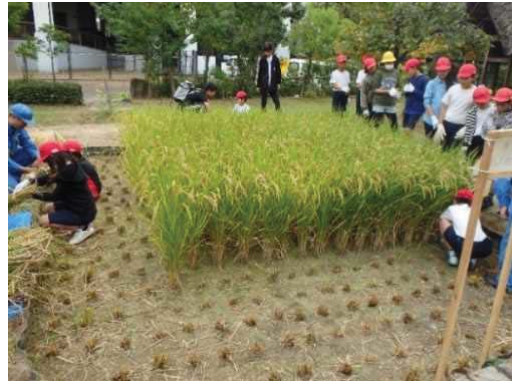
「せせらぎの里」での農事体験の様子

鶴見緑地内にある自然体験観察園の水田や畑において、農事（田植え等）体験や講座を実施しています。また、住之江抽水所にある「せせらぎの里」では、近隣の小学生を対象とした田植えや稲刈りの体験行事を実施しています。