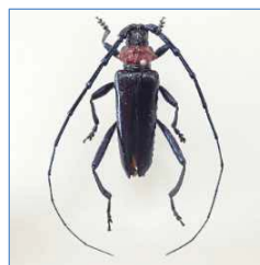
クビアカツヤカミキリ（オス）

国が主催する近畿地方外来生物対策連絡会議に参加し、国や自治体を実施する外来生物の防除等に関する情報を共有しています。