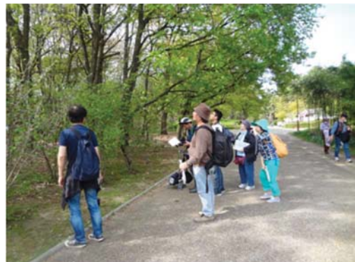
生き物調査の様子

また、平成30年度より市立小学校において児童と一緒に校内に生息・生育する生き物の調査を実施しています。令和元年度は30校で実施しました。