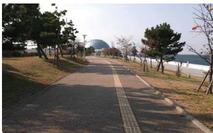
コスモスクエア海浜緑地

緑地や親水堤防等、多くの市民や港を訪れる人々が憩い、集える空間を整備しています。