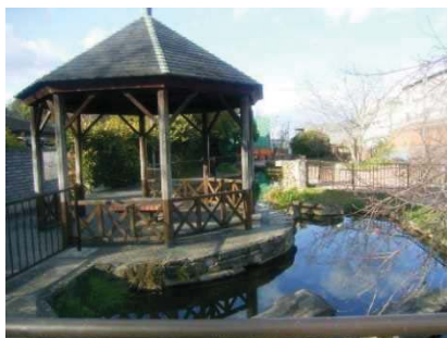
平野下水処理場内異水路

快適環境・リサイクル型社会の実現に貢献するため、下水処理水の有効利用を進めており、「せせらぎ」のある修景施設などに利用することで、美しい水辺空間を創造しています。