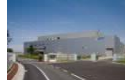
北海道(室蘭)事業所