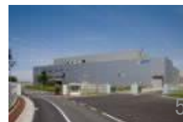
北海道(室蘭)事業所