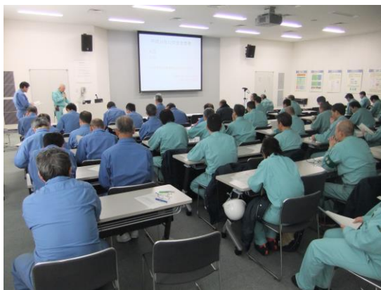
教育（平成 26 年 12 月 18 日） 火災・地震対応教育