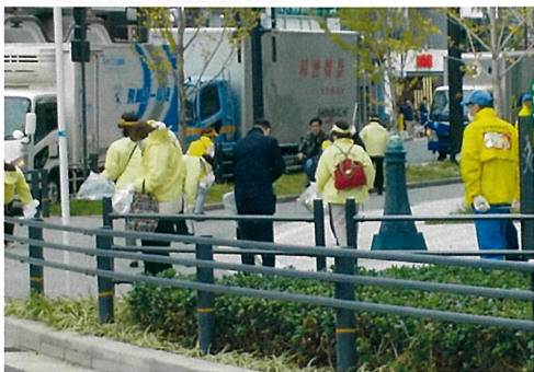
▶大阪マラソンクリーンUP作戦において、清掃活動をしている様子

「大阪マラソンクリーンUP作戦」では、大阪市内外から多くの参加者が集まる大阪マラソンの開催前に、マラソン参加者や関係者、観客を「きれいなまち」で迎えるため、市民、事業者団体等により大阪市全域を清掃しています。多くの参加者が集まることによる経済効果(経済)や、大阪の魅力向上と清掃活動を通じた地域のつながり(社会)、「きれいなまち」づくり(環境)のすべてが、つながりをもちながら効果的に発展していくことが期待できます。