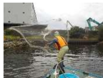
投網による採集の様子 (木津川)

大阪市の水環境の状況を市民と共有するためには、わかりやすい指標が必要であることから、市内河川に生息する魚類を調査することにより、大阪市の水環境についてよりわかりやすく情報発信します。