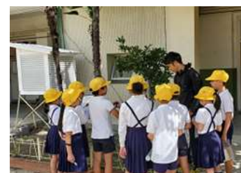
小学校での生き物さがしの様子

小学校内などにある身近な水辺などで、専門家と共に生き物さがしを実施することにより、自然に触れ、生物を発見し、生物多様性 ※ の重要性について学習する取組みを進めます。