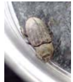
コスナゴミムシダマシ