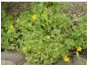
オッタチカタバミ