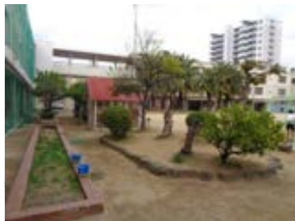
ふじだなしゅうい