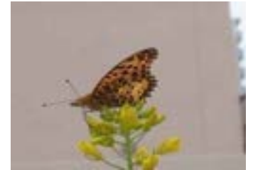
ツマグロヒョウモン