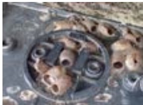
ヒロヘリアオイ (まゆのから)