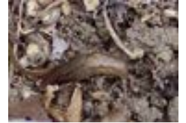
チャコウラナメクジ