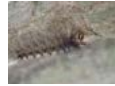
マイマイガ (よう虫)