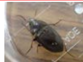
アカアシマルガタゴモクムシ