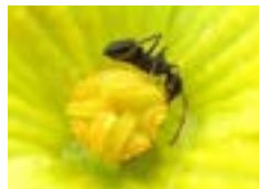
ケブカアメイロアリ