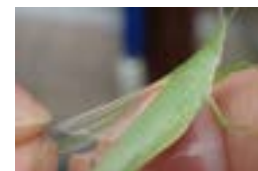
アカハネオンブバッタ