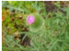
アメリカオニアザミ