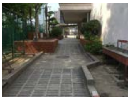
こうどうしゅうい