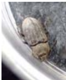
コスナゴミムシダマシ