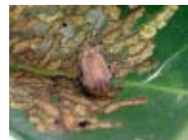
サンゴジュハムシ