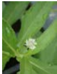
アメリカタカサブロウ