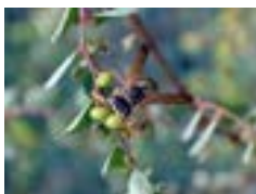
フタモンアシナガバチ