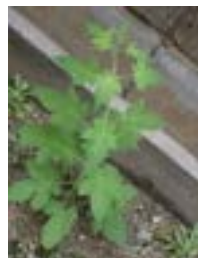
ヒヨドリジョウゴ