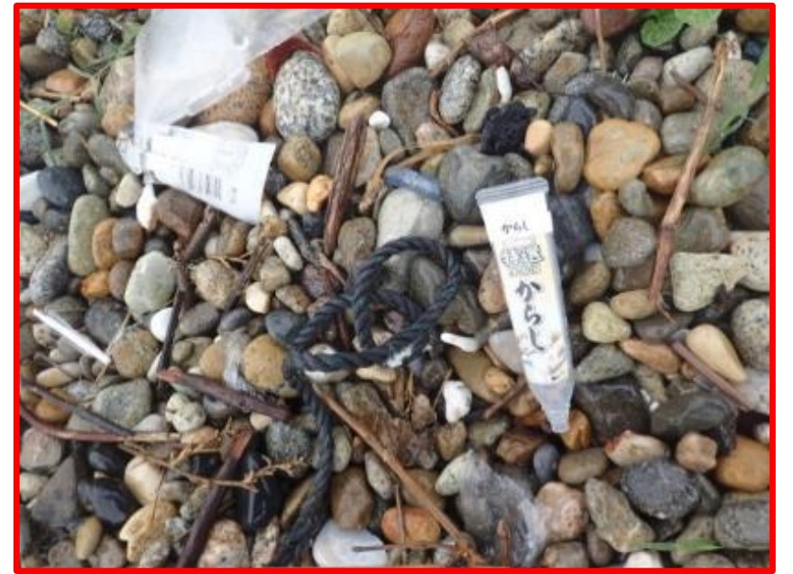
ようき チューブ容器