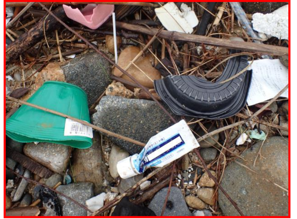
かわぎし み 川岸で見つけたごみ