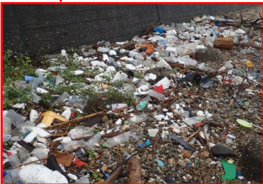
かいがん なが 海岸に流れついたごみ