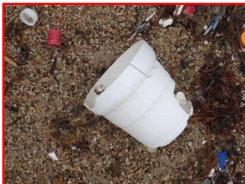
うえき ばち 植木鉢