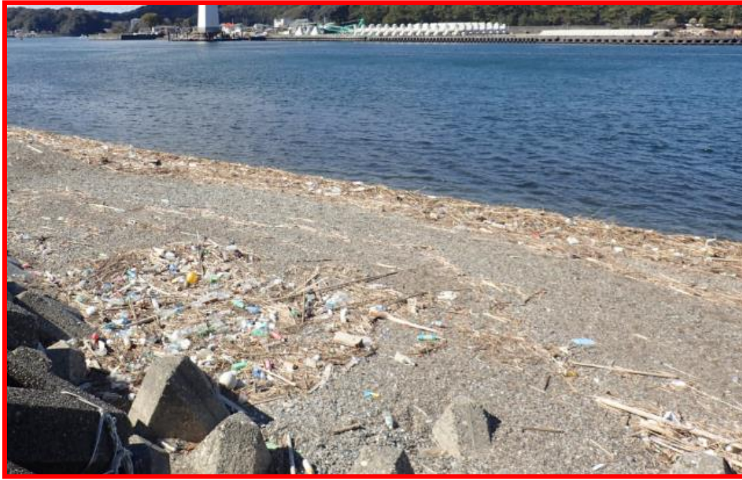
かわぎし ようす 川岸の様子

ほとんどのかいよう 海洋プラスチックごみ（ペットボトル、レジ袋など）は、ポイ捨て やふほうとうきとう 不法投棄等によって陸上で発生し、りくじょう 雨やあめ 風の影響を受けてかわ 川をなが うみ 海にたどり着きます。そのため、うみ 海のごみとかわ 川のごみはよく似ています。