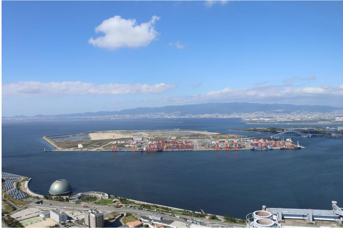
図 5.13.5(1) コスモタワー展望台からの景観（現況）