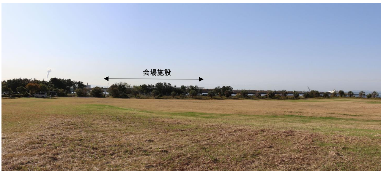
図 5. 13. 3 (2) 太陽の広場からの景観（施設完成後）