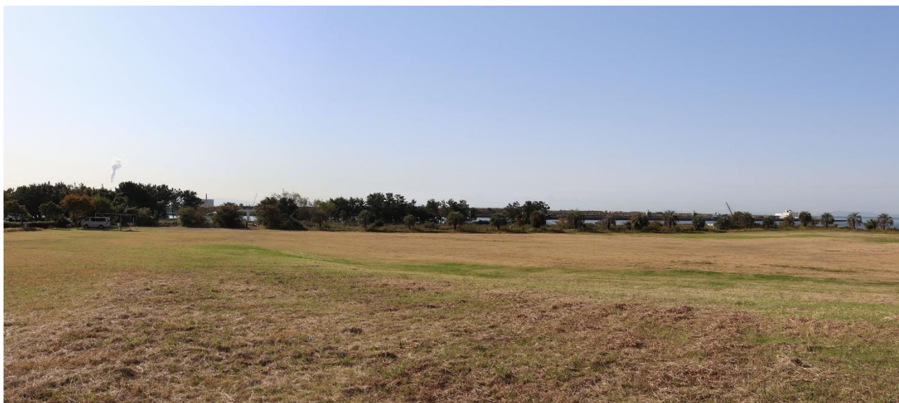
図 5. 13. 3 (1) 太陽の広場からの景観（現況）