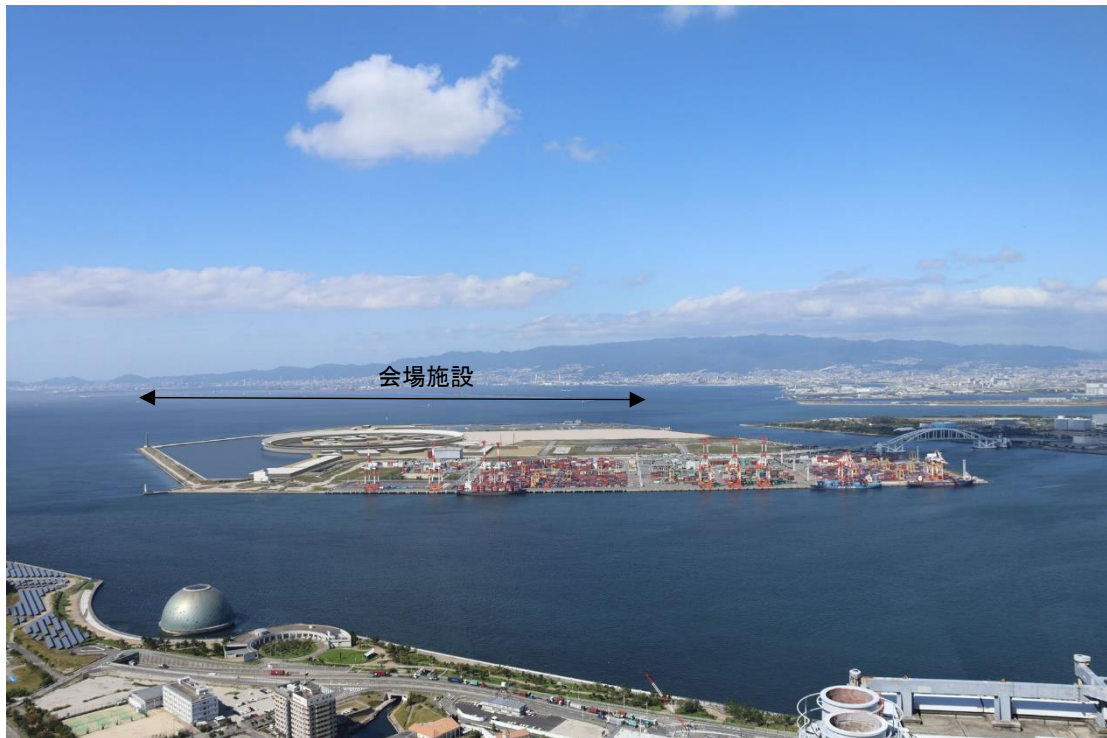
図 5.13.5(2) コスモタワー展望台からの景観（施設完成後）