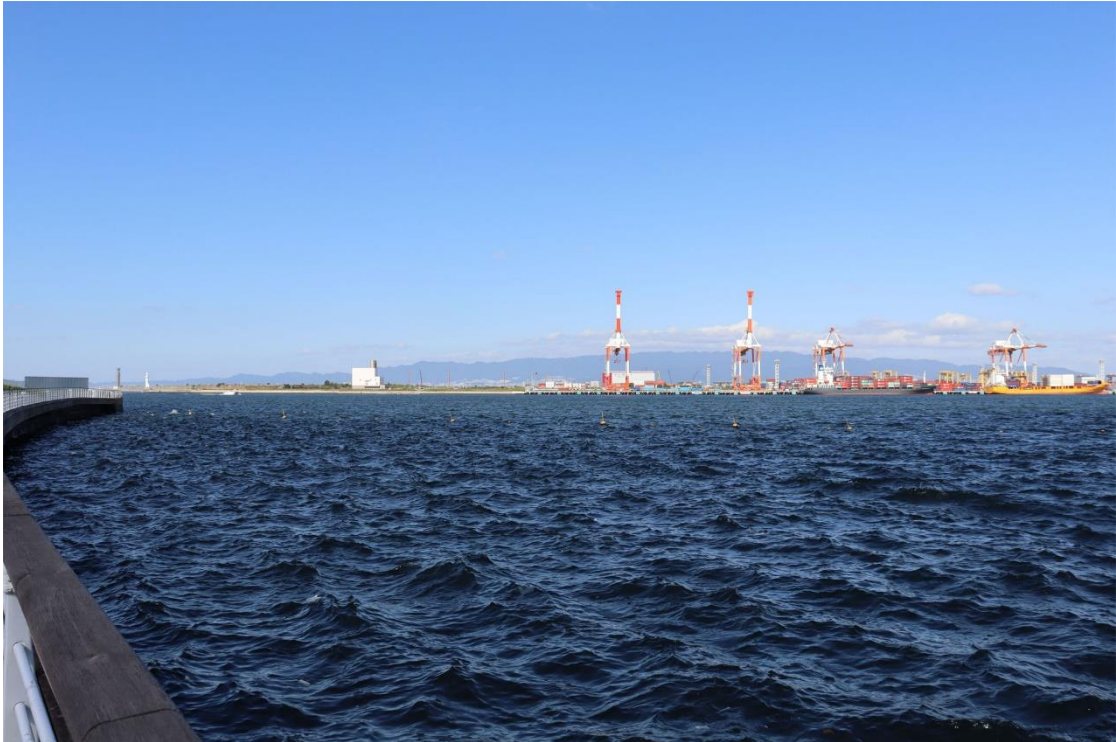
図 5.13.4(1) シーサイドコスモからの景観（現況）