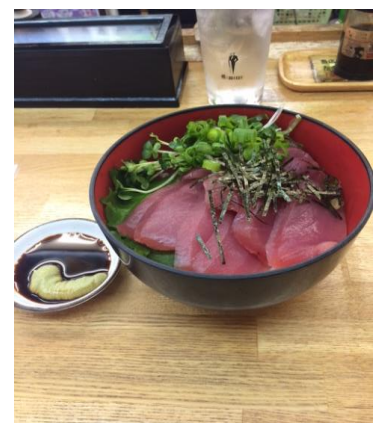
お勧めメニュー「鉄火丼」

“鉄火丼”や大エビと大穴子が入っている“天丼”が売り切れ必至のおすすめ!です。「フレッシュではらストア」では、新鮮な生鮮食品を取り揃えており、3,000円以上のお買い上げで城東区内に限って配達サービスを行っており、団地にお住まいの方々に好評です。「今後は、近隣の商店を巻き込んでポイントカードの発行などに取り組んでみたい。」とのこと、多彩なアイデアをお持ちです。「城東商店街」にお越しの際は、ぜひこちら