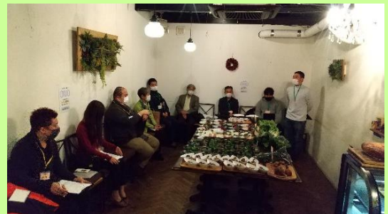
(マッチングイベントの様子)