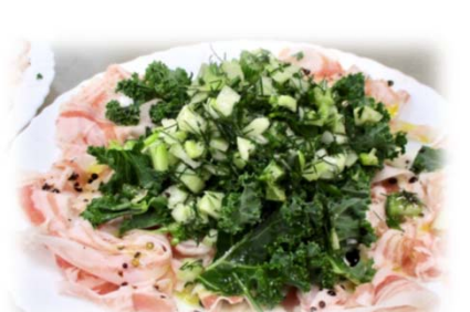
（フェンネル、ケール パンチエッタのサラダ）