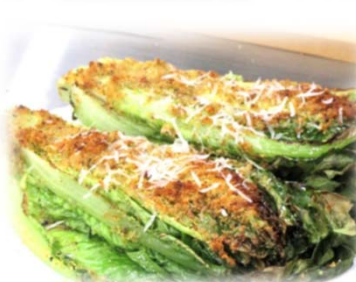
（ロメインレタスの 香草パン粉オープン焼き）