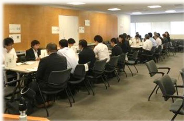
大阪市内中小製造事業者と工業系学科を有する大阪府立高校との交流会