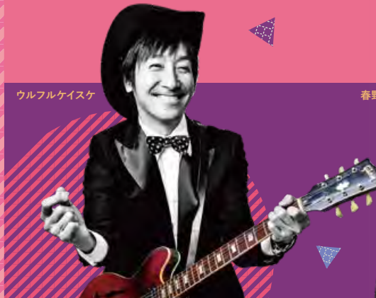
ウルフルケイスケ