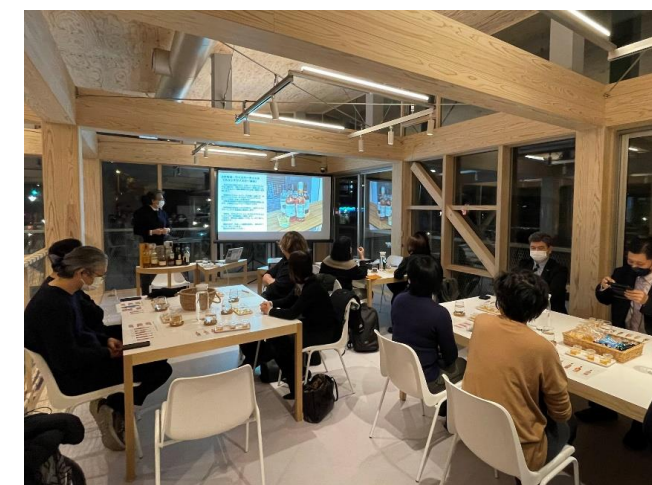
ウイスキーの歴史的背景を学びつつテイスティング