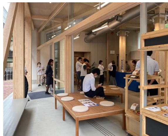
水辺・まち・人をつなぐキオスク