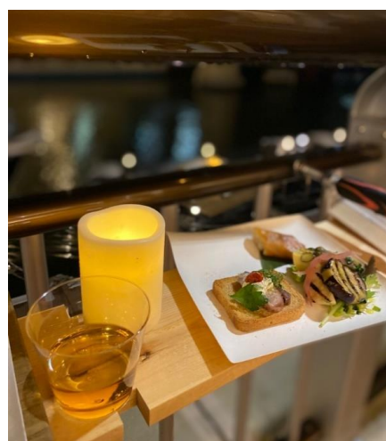
手すりへのクランピングによるカウンターで、水辺で食事を楽しむ