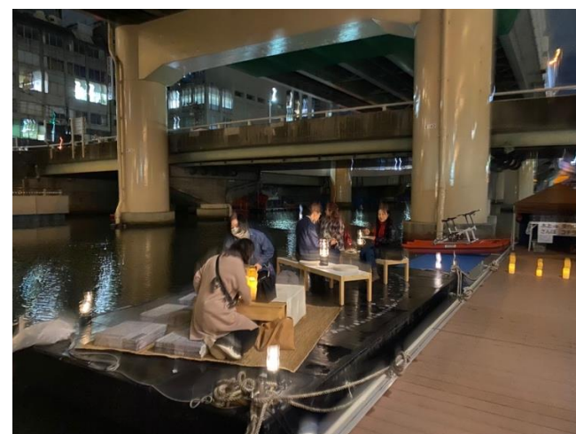
水上でも食事を楽しめる