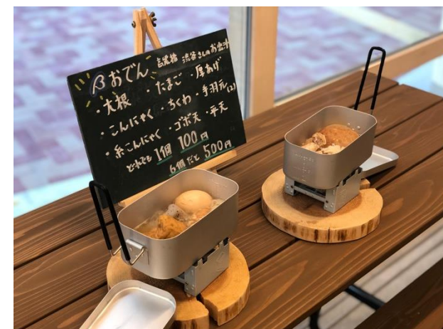
地域のお店の商品を使ったメニュー（出汁）