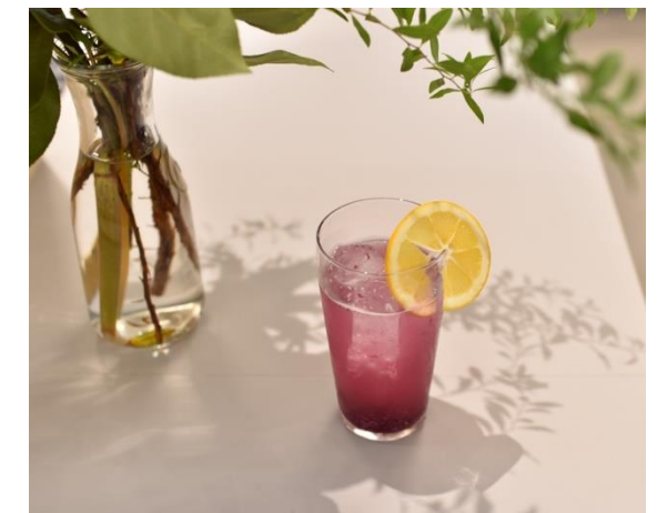
大阪産野菜にこだわった季節ごとのメニュー展開