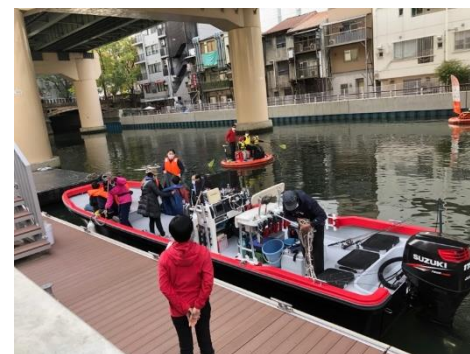
まちなかから釣り船で出発