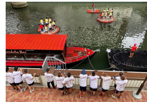
高校生の体験授業

■ 次年度の方針 ・身近な水辺の価値と魅力を知っていただくため、特に地域にお住まいの方やお勤めされている方々を対象に、「水上運動会」と「水上キャンプ」に挑戦する。