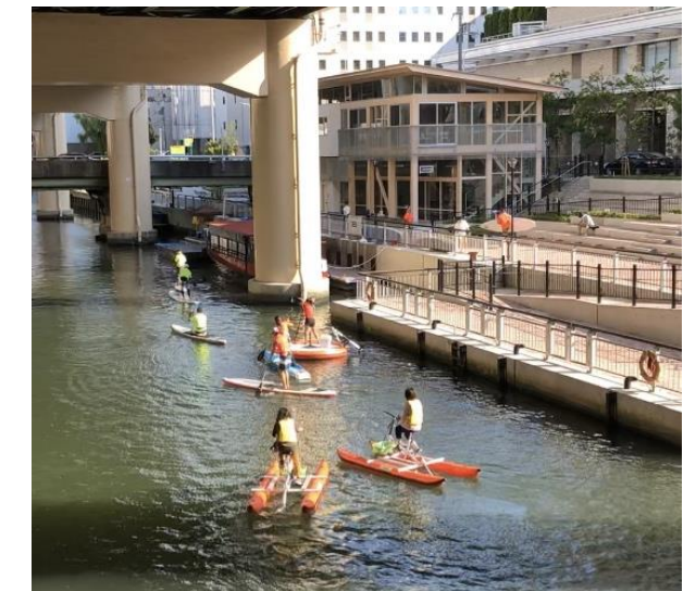
多様な人力船が集う手漕ぎ天国