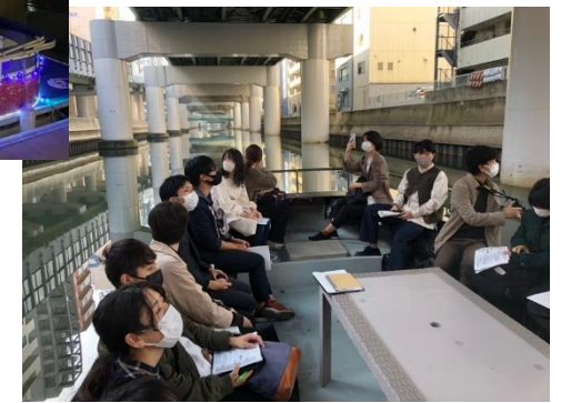
調査のためのクルーズ