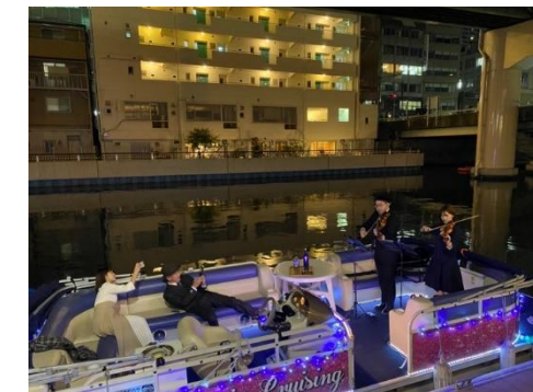
楽器の生演奏を楽しむクルーズ