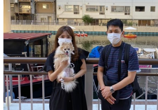
犬と中之島さんぽを楽しむクルーズ