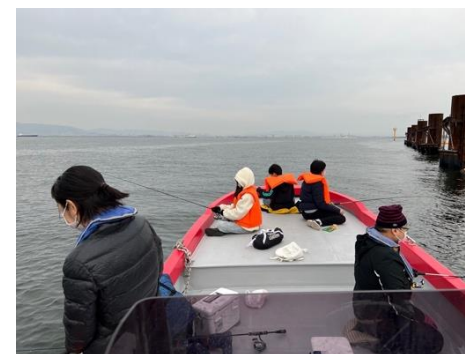
大阪湾での釣りの様子