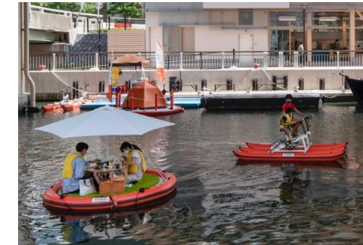
水上ピクニックと水上自転車