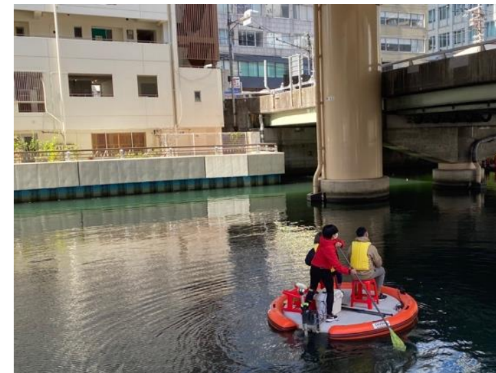
スタッフさんにアテンドしてもらうガイドツアー