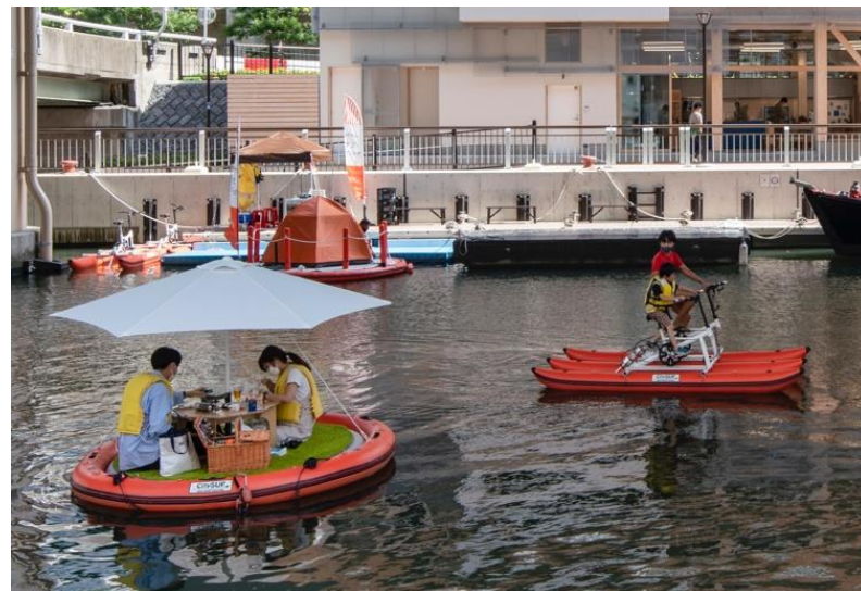
水上ピクニックと水上自転車