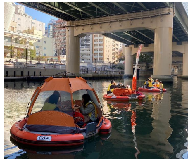
冬はこたつで水上ピクニック