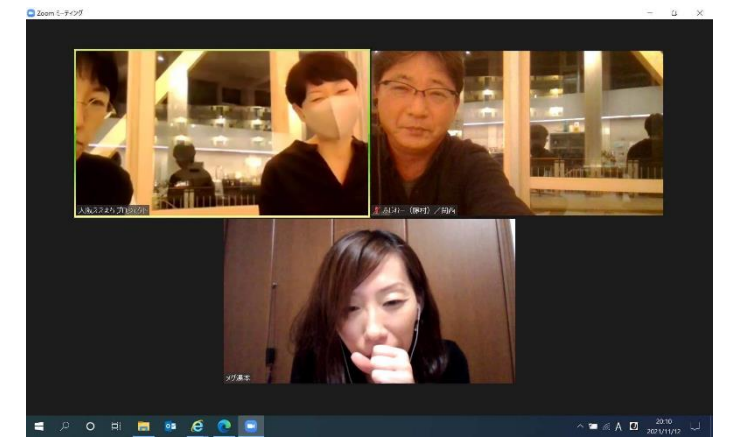
高山村観光協会オンライン意見交換