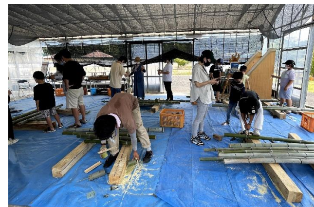
いずもくプロジェクト視察・意見交換