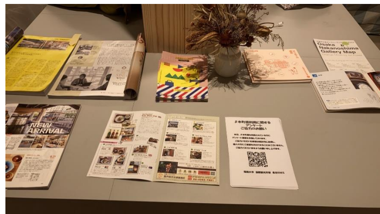
阪南大学のアンケート調査票をキオスク周辺に設置協力