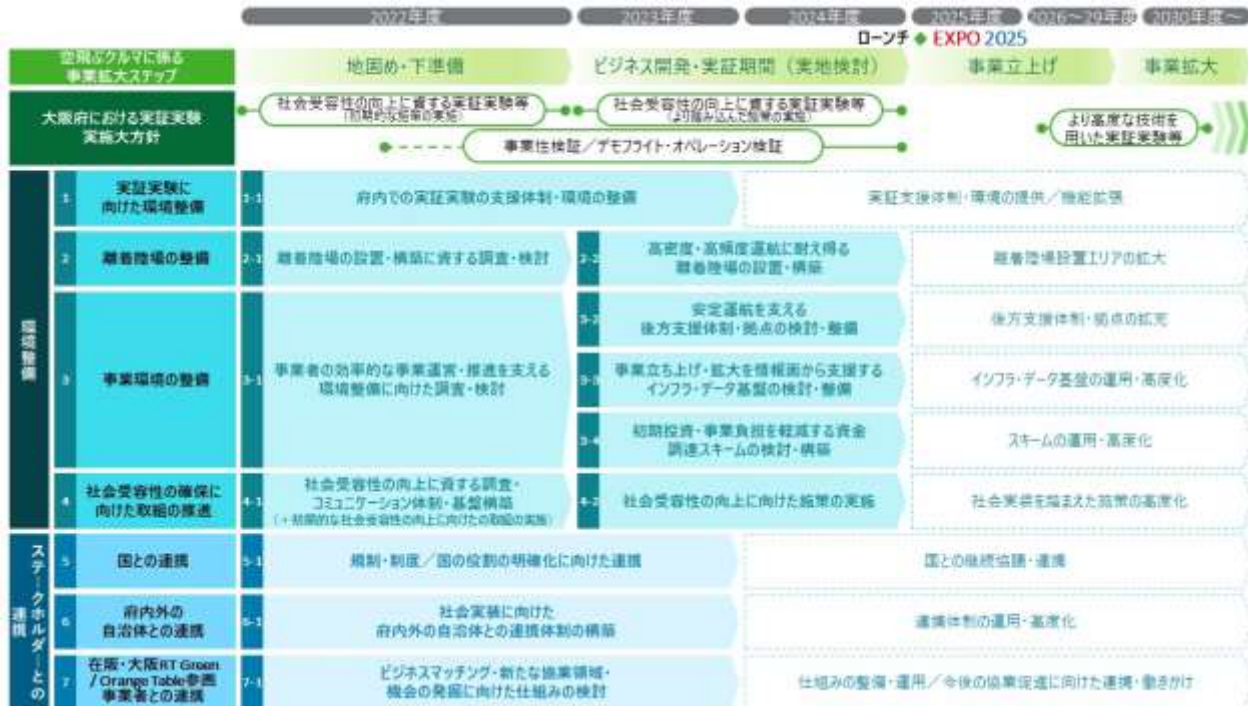
【参考1：空の移動革命社会実装に向けた大阪版ロードマップ/アクションプラン】

参考：大阪府作成パンフレット ( https://www.pref.osaka.lg.jp/attach/39723/00000000/pamphlet.pdf )