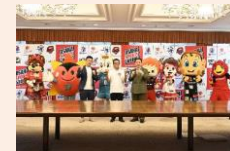
スポーツ応援事業