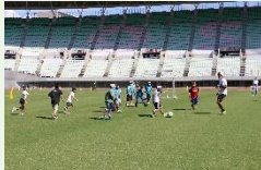
Do Sports Fes 2022