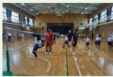
トップアスリート「夢・授業」