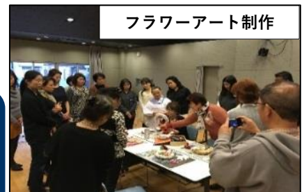
フラワーアート制作