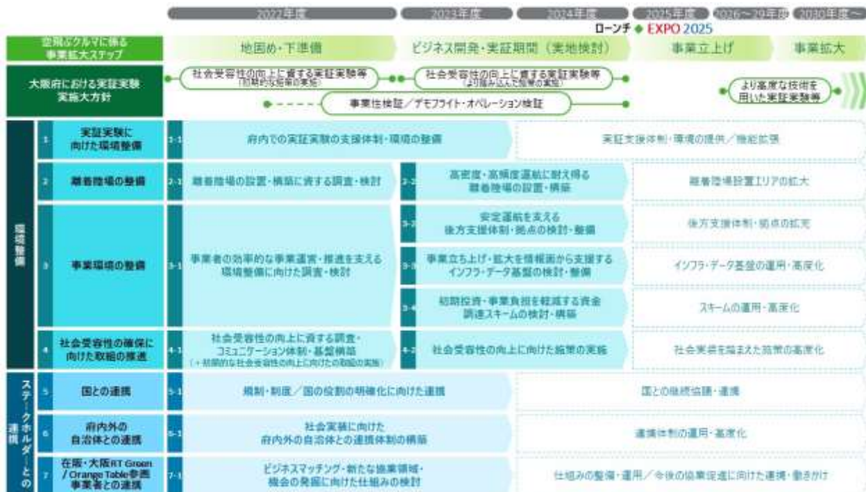
【参考1：空の移動革命社会実装に向けた大阪版ロードマップ/アクションプラン】

参考：大阪府作成パンフレット ( https://www.pref.osaka.lg.jp/attach/39723/00000000/pamphlet.pdf )