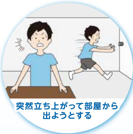
突然立ち上がって部屋から出ようとする