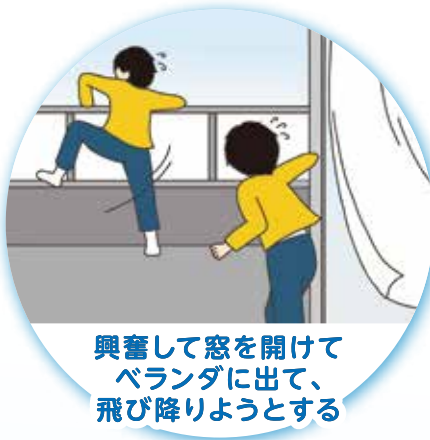
興奮して窓を開けてベランダに出て、飛び降りようとする