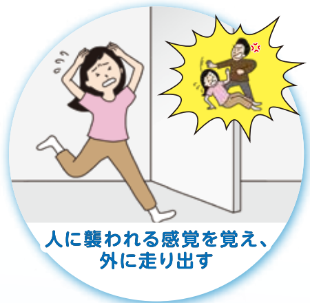
人に襲われる感覚を覚え、外に走り出す