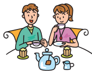
コップでの回し飲み