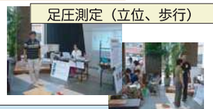
指導（立ち方・歩き方・足指運動など）