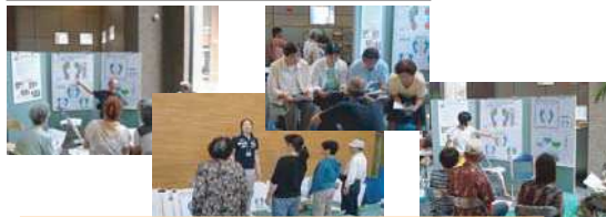
提案資料（シニアライフ応援協会）

☆今回、事業提案をされた団体については、協議中のものを含めると、4団体すべてが協働に結び付きました！協働の相手先を見つけるチャンスでもありますので、意見交換会へのご参加を心よりお待ちしております。