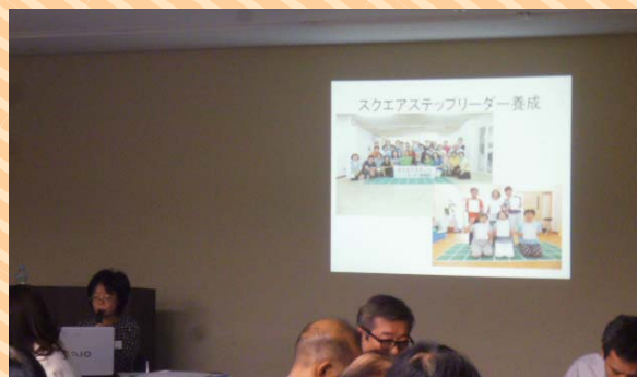
提案風景（ヘルスコープおおさか）