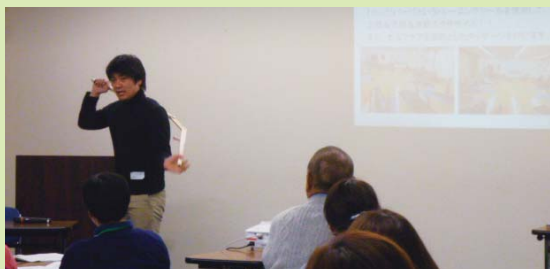
提案風景(NPO法人MYフィットネス道)