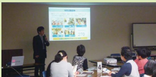
提案風景(あべのハルカス近鉄本店縁活運営事務局)