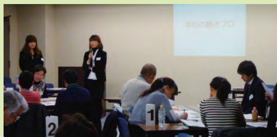
提案風景(一般社団法人聴きプロ.com)