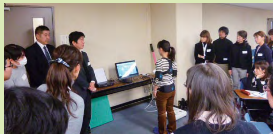
提案風景(ニッタイ株式会社)