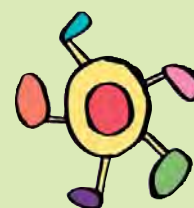
すこやか大阪21 (いっぼくん)

意見交換会では団体の代表者の方が参加され、直接、顔を合わせて意見交換ができます。他団体との協働は、パートナー活動のさらなる発展につながる可能性がありますので、意見交換会へのご参加をお待ちしております。