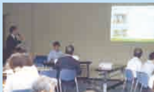
提案風景(大阪スポーツみどり財団)