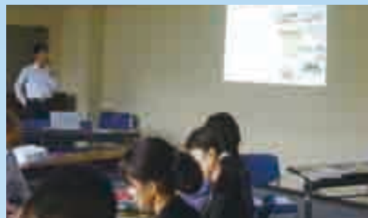
提案風景 (「大阪発、公園からの健康づくり」推進グループ)