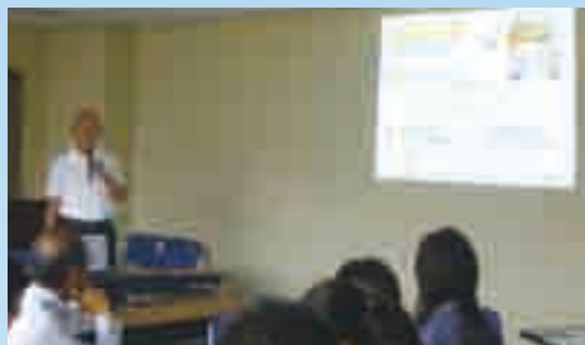
提案風景(シニアライフ応援協会)

平成28年6月8日(水)に「第17回すこやかパートナー意見交換会」を実施しました。当日は、すこやかパートナー35団体、4区役所にご参加いただき、すこやかパートナー4団体から協働事業の提案を行っていただきました。参加された団体及び区役所において、意見交換や情報交換、名刺交換が行われ、活発な交流が図られました。