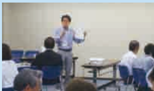
提案風景(認知症は怖くない)