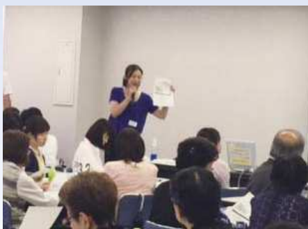
大王製紙株式会社