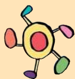
すこやか大阪21 (いっぼくん)

平成29年6月21日(水)にあべのハルカス近鉄本店8階街ステーションで開催した「かしこく食べよう!骨骨(コソコソ)貯めよう!」キャンペーンを紹介します。すこやかパートナーの「あべのハルカス近鉄本店縁活事務局」さんにご協力いただきました!