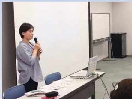
一般社団法人 ロカロジ協会(妊娠糖尿病の会)