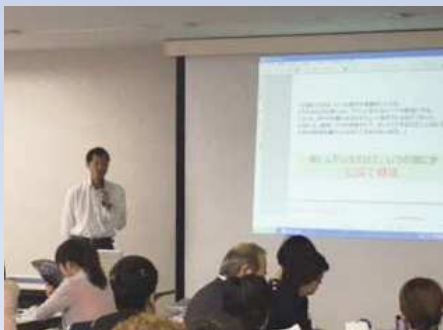
一般社団法人 公園からの健康づくりネット

平成29年5月30日(火)に「第20回すこやかパートナー意見交換会」を実施しました。当日は、すこやかパートナー34団体、10区役所にご参加いただき、すこやかパートナー5団体から協働事業の提案を行っていただきました。参加された団体及び区役所において、意見交換や情報交換、名刺交換が行われ、活発な交流が図られました。