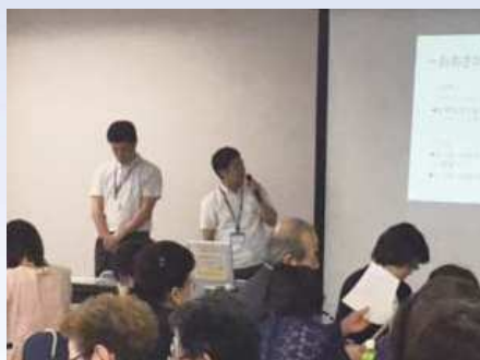
大阪きづがわ医療福祉生活協同組合・ 生活協同組合ヘルスコープおおさか健康づくり委員会

意見交換会では団体の代表者の方が参加され、直接、顔を合わせて意見交換ができます。他団体との協働は、パートナー活動のさらなる発展につながる可能性がありますので、意見交換会へのご参加をお待ちしております。