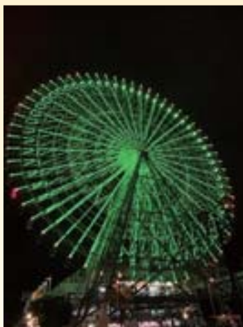
セミナーで紹介した5/31世界禁煙デーでの天保山大観覧車のライトアップ