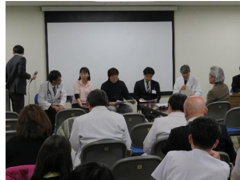
シンポジウム形式