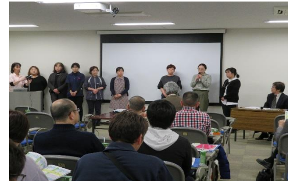
訪問ステーション事業所から事業所紹介