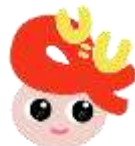
U (ゆー) ちゃん

実施日が祝日・年末年始等（閉庁日）にあたる場合は検査は実施しません。 そのほか、chot CASTについては、8月13日～8月15日はお盆休みのため休館となります。