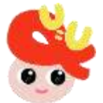
U (ゆー) ちゃん

実施日が祝日・年末年始等（閉庁日）にあたる場合は検査は実施しません。 そのほか、chot CASTについては、8月13日~8月15日はお盆休みのため休館となります。