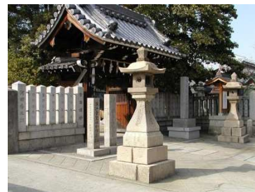
4 摂津笠縫邑跡 深江菅笠ゆかりの地