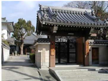
2 妙法寺 契冲遺跡