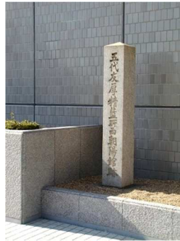
27 五代友厚製藍所跡