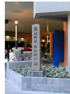
94 難波御蔵 難波新川跡