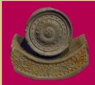
難波宮跡で出土した軒瓦 (大阪歴史博物館蔵)