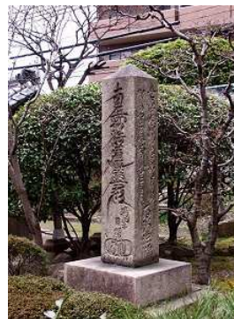
22 西行と遊女妙の歌碑（江口君堂）