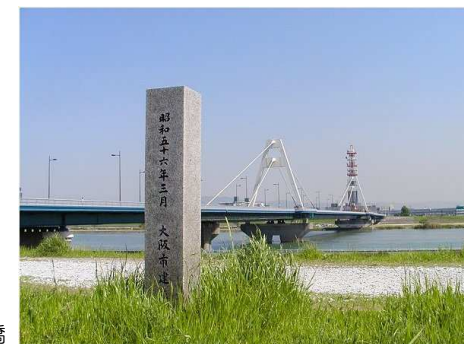
27 平田の渡し跡と豊里大橋