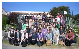
昨年の淡路花めぐりツアー

3年前から毎月第4金曜日に区役所で勉強会を開いています。今年は「城北菖蒲園」や堺市