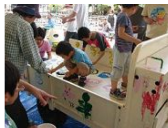
みんな真剣に塗っています。臭いの少ない水性の塗料を使いました。

ン教育研究所の学生の皆さんの協力を得て、「春の動物と花のフェスティバル」の一環として、5月5日に「リサイクルフェスタ」と銘打って、1台は公園の噴水前ステージで、天王寺小学校の生徒たちによって、