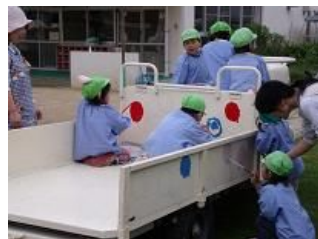
運転席に乗ったり、赤や青の水玉模様を塗ったりして園児たちも楽しんでいました。

今回、3台をペイントすることになり、1台は西成区内の保育所の園児たちが考案した図柄を、園児たち自らの手によって塗装してもらいました。