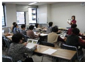
皆さんが楽しかった〜と笑顔で言ってくれるのが一番嬉しいご褒美です。(高田談)