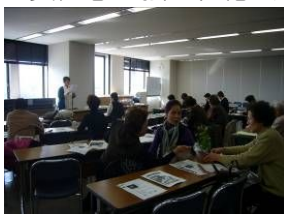
花のメッセンジャーとして植物との一期一会を紹介しています。(浜野談)

浜野GCは暗算が得意な「友の会」の会計。責任感が強く、花広場の備品消耗品管理を担当。園芸店周りが何より大好き。