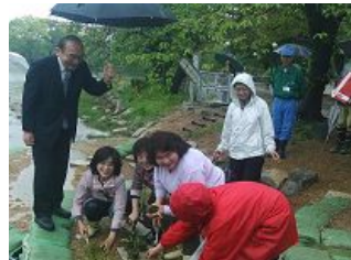
雨にも負けず植え付けました。

池の水を流すことによる水質浄化、植物の世話や生態系の改善に地域力の協力を得る市民協働、自然生態系のモデルを再現することによる生物の多様性の実現と環境学習をめざして整備されました。