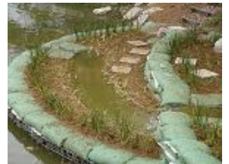
完成！1年後は鮮やかなカキツバタが水辺を彩るでしょう

引き渡し式に集まったボランティアの皆さんは、当日の雨にも負けず「花いっぱいの万代池にしていきたい」との思いを込め、500株の苗を和気あいあいと植え付けていただきました。