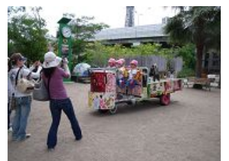
動物園内ライオン広場に置かれたオブジェに乗ってハイポーズ。

殺風景だった構内運搬車の荷台は華やかに生まれ変わり、早くも来園した子どもたちに人気のオブジェとして親しまれています。