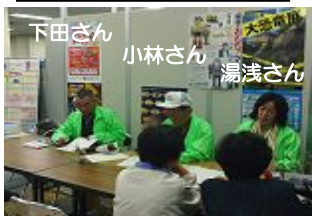
5/11東淀川区役所での緑化相談。グリーンコーディネーターの皆さんにお手伝いいただきました。