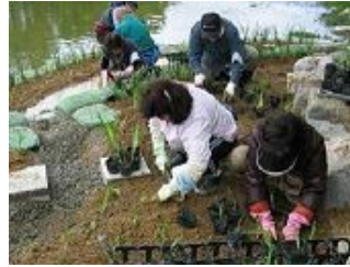
花いっぱいにするでえ

このカキツバタビオトープを管理・育成していくため、万代池公園愛護会・すみよし環境区民会議・住吉地区社会福祉協議会の有志が集まり「万代池カキツバタビオトープクラブ」を結成し、今後は南部方面公園