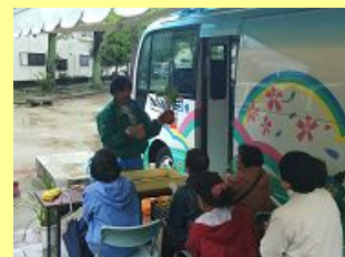
4/22 此花公園(此花区)での緑化講習会

今月は下記の日程でお伺いします。時間はいずれも 14:00~16:00 です。(参加自由・無料、雨天決行)