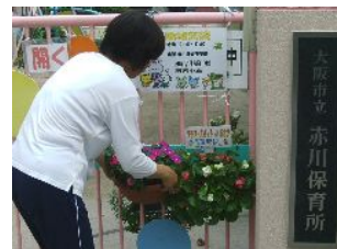
ハンギングバスケットで保育所通用門が艶やかに変身

挿し芽をしたハナスベリヒユなどを、ボランティアの皆さんで6月25日にハンギングバスケットに植え付け、7月2日には区内の保育所に飾り付けを行いました。