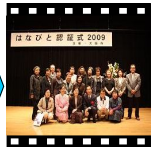
ようやく卒業！昨年は22の方が認証されました。