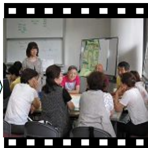
ワークショップ初体験、いろいろなアイデアがだされました。