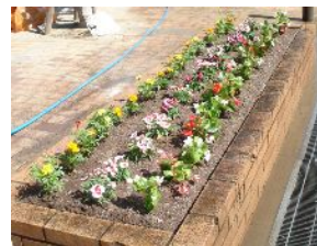
花いっぱいの公園に