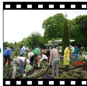
花壇への植え付け実習。力を合わせ手際よくできました。