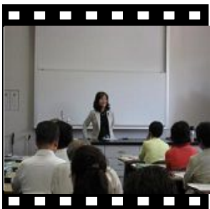
開講式に引き続き、外部講師による講習会に聞き入る受講生。