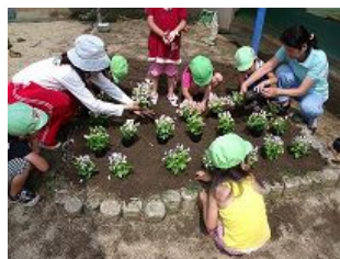
子どもたちもいっしょに植え付け(長橋第1保育所)

されており、年間8万株もの花苗を育て、区役所や駅前花壇、緑道や多くの公共施設に花を飾り、うるおいのある美しい西成区のまちづくりに貢献されています。