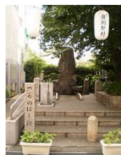
つるのはし跡公園