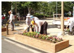
楽しく育てています

「公園を訪れる方々が、美しい花が咲いたのを見て心を癒していただけたら、これこそが高齢者の大きな楽しみであり、生きが