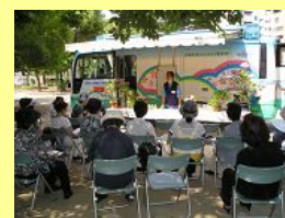
6/17 中大江公園(中央区)での緑化講習会。