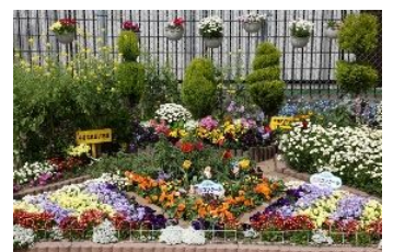
作品名「多くの人に微笑を」

笑んでもらえるようにメンバー一同がんばっています。」と、喜びの声をもらいました。