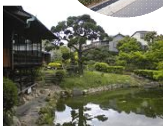
加賀屋緑地(加賀屋新田会所跡)