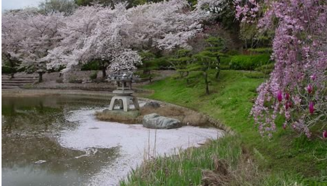
池に映し出された・艶やかな桜・・・(鶴見緑地日本庭園)