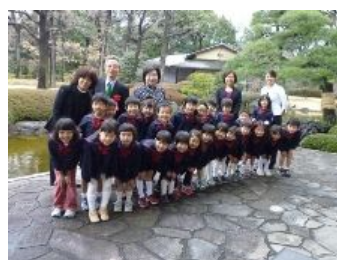
受賞の喜びが笑顔にあられます。