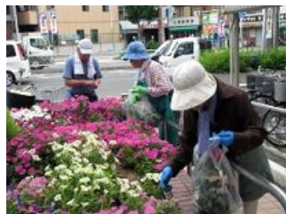
ていねいに花ガラ摘み(区役所前花壇)

一昨年から取り組んでいる東成区の伝統野菜の「玉造黒門越瓜」や「ゴーヤ」を使った区役所の壁面緑化には、一般の市民ボランティアの方々にご協力いただき、庁舎を緑でいっぱいにすることができました。