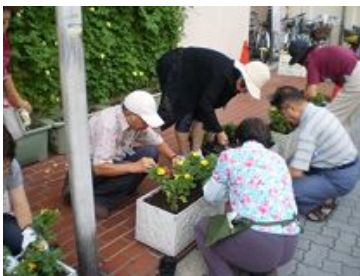
花いっぱい咲かせます(玄関前)

これからも、園芸を通してふれあい、情報交換や人の輪を広げていきたいと願うとともに、元気で年を重ねていければと思っています。