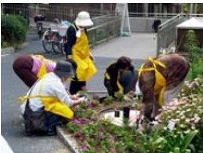
きれいな花で元気をあげたい(府立成人病センター)

森之宮の府立成人病センターでは、近隣の緑化リーダーの皆さんが、花壇作りや手入れを当番制でお世話してこられたことで、訪れる方の癒しとなっています。