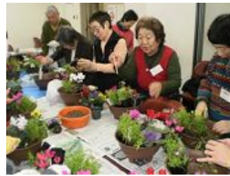
きれいに 完成しました。

また、年2回の寄せ植え教室は、和気あいあいとした雰囲気のもと、楽しいひとときを過ごし