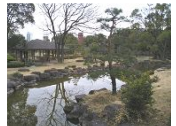
滝石組からの流れ(旧藤田邸庭園)

旧藤田邸庭園は、明治時代の実業家、藤田伝三郎氏の邸宅跡を整備したもので、築山・滝・流れを基本に構成され、豪壮的な自然の情景を感じさせます。