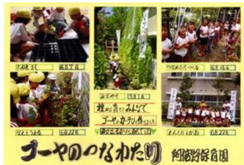
「ゴーヤのつながり」阿倍野保育園の皆さんの作品

昨年の秋に、「緑のカーテン&カーペット いっしょにやいまひよ隊」の皆さんに育てていただいた緑のカーテン&カーペットを題材としたコンテストを実施しました。応募作品(個人の部44点、その他の部22点)の中から、最優秀賞2点、優秀賞9点、特別賞3点がそれぞれ選出されました。