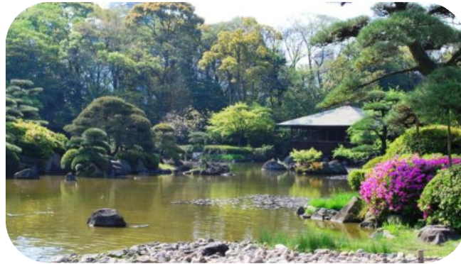
春を迎え、緑がいつそう映える(慶沢園)

加賀屋緑地には、枯山水の前庭や小堀遠州風の築山林泉式庭園、数奇屋風茶室(鳳鳴亭)が現存し、大阪の近世史や地域の歴史を考えるうえで貴重な施設となっています。