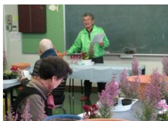
わかりやすく、丁寧に(三谷GC)

そして、この4月からは、バスのひふみ号を使った緑化講習会の講師もさせていただきます、活動の場が広がっています。