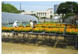
出荷前に最後の手入れ (都島区花づくり広場)

一方、これまで整備してきた花づくり広場に対して、「植付け場所までの運搬に苦勞している」「花づくり広場まで通うのがたいへん」