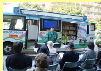
4/5真田山公園(天王寺区)での花と緑の講習会。