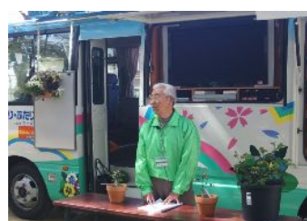
初めてのひふみ号講習(廣目GC)