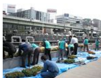
北区バラの会の皆さんと いっしょに植え替え