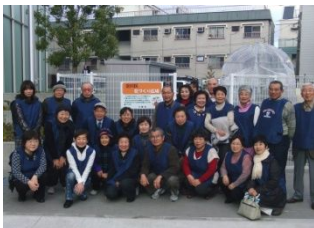
夢ちゃん花づくり隊のメンバー

本年1月25日、淀川区役所敷地内に待ちに待った花づくり広場が完成し、区内のグリーンコーディネーター、緑化リーダーを中心とした24名の種花ボラン