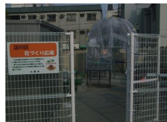
夢ちゃん花づくり広場

ても小さな花づくり広場ですが、ここから街中に綺麗な花を咲かせ、潤いのある淀川区にしたいと、各班が毎日交替で水やりや花苗