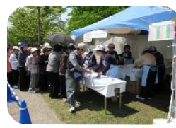
人気のハーブティーサロン