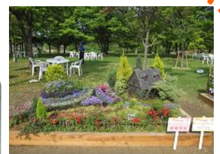
昨年の市民花壇コンクールは「港区花みどり友の会」が最優秀賞を受賞しました。