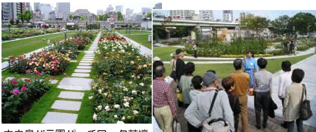
中之島バラ園パッチワーク花壇

「水都大阪フェス2011」のメイン会場である中之島公園内の中之島バラ園には、約310種、約3700株のバラが植えられています。歴史の流れを表わすパッチワーク花壇のバラ、水面に映えるよう立体的に配置された数々のバラが、「水都大阪フェス2011」の会期中に見事に咲きます。