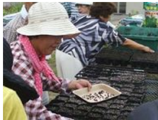
一粒一粒ていねいに種播き(都島区)

10月30日(日)に開催される「第1回大阪マラソン」の成功を応援するため、種から育てる地域の花づくり事業に取り組んでいただいているボランティアの皆さんが育てたひまわりをマラソンコース沿道等に飾りつける取組み「ひまわりプロジェクト」。