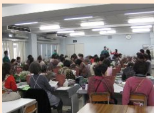
各会場とも大人気

天王寺区では、寄せ植え講習会を区内在住の方々幅広く受講してもらえるように、毎年12月、4ヶ所の会場で開催しています。定員は各会場70名で、合計300名近い人が緑化講習を受けることができます。寄せ植えのデザインから材料選び、講師(グリーンコーディネーターの中で選出)に至るまで、すべて『グリーンリー天王寺』の定例会で決定し、当日の講習会のお手伝いは『グリーンリー天王寺』のメンバーでやります。