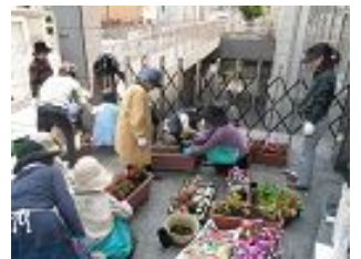
クレオ大阪中央前花飾り

また各地区に配布した花苗のメンテナン스가いきとどいているのか、天王寺区内の公園や街が、花飾りによって近ごろだんだん美しくなってきたような気がします。