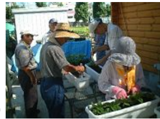
残暑の中での作業(東住吉区)