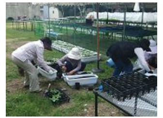
よっころしよ(此花区)