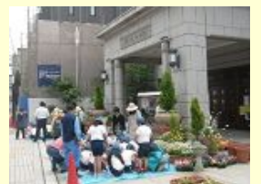
区役所前の花飾り

13年前から、五条地区の緑化リーダーが中心となって、天王寺区の顔である区役所の玄関を、美しく飾り続けています。今では、五条地区以外からのメンバーも増えて、『グリーンリー天王寺』の活動の一つとなっています。また、五条小学校4年生の総合学習の時間をいただき「花いっぱい運動」として年3~4回、子どもたちや地域の方々といっしょに花飾りを作っています。子どもたちは、花や土に触れることが嬉しくて、みんな目を輝かせています。私たちが「花のゆりかご」で、大切に育てた花たちも、花飾りの出番を待っています。