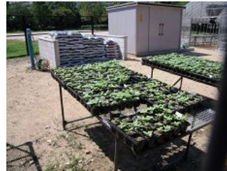
順調に育っています(住之江区)