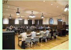
今年の総会のようす

毎月の定例会には、幹事は区内全地区から参加し、緑化リーダーもそうでない人も、真田山公園事務所や区役所の職員も、みんないっしょになって議論して案件を決めています。そして、その結果についてはスムーズに各地区に発信する事ができる、そんなチームワークの良い楽しい会です。