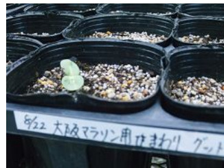
種播き3日後に発芽(西区)

途中、集中豪雨や台風の影響もあり、ボランティアの皆さんの中にはハラハラされた方も。