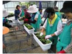
ひまわりの成長に笑顔(北区)