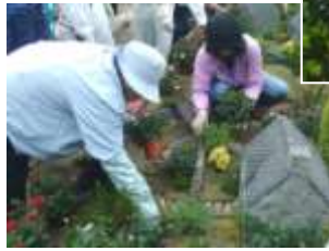
植え付けには18人が参加され、ミニバラを中心に、花壇をていねいに植え付けました

5月7日、天王寺動植物公園において、5月19日～20日に実施したローズツアーに合わせ、バラのミニチュアガーデンを天王寺ローズ会員のボランティア皆さんとともに作成し、ツ