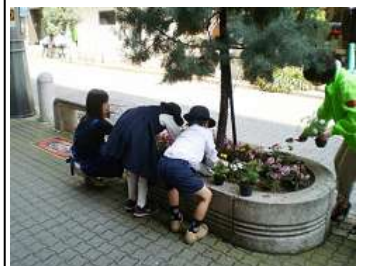
デザインを考えながら植え付け