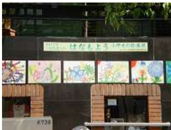
3年生の児童たちの絵画が飾られビルの壁面が美術館に様変わり

ボランティアの皆さんが作った小さなバラ園が、訪れる来園者を楽しませてくれています。