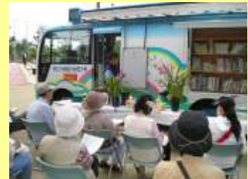
5/10 今津公園(鶴見区)での花と緑の講習会