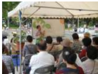
身振り手振りでの辻GC