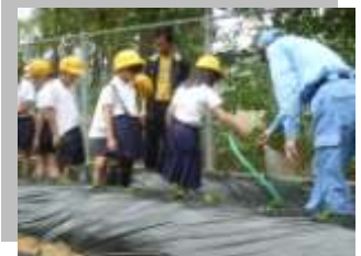
▲ 真剣なまなざしの子どもたち