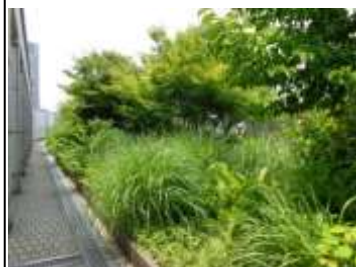
北ブロック：里山草地

感があり、ハナミズキ、 サルスベリ、バラなどの 花木類や地被類を中心 に植栽しており、四季 折々の美しい草花を観 賞することができます。