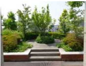
中央がシンボルツリーのカラミザクラ 南ブロック：西南テラス広場

自然や緑、花にふれあ い、都市の緑の大切さを 実感できる空間をめざ して、平成16年(2004 年)春に大阪市役所屋上 緑化施設が完成しまし た。