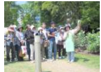
ツアーガイドでの片上GC

片上GC・辻GCから、「最初は緊張もしましたが、挑戦して良かったです。今回の講習会とツア