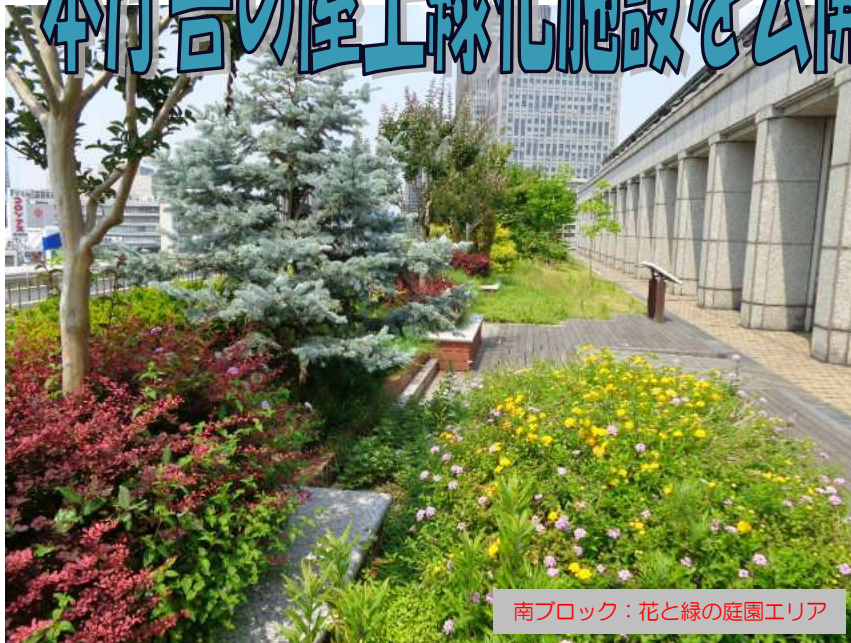
南ブロック：花と緑の庭園エリア