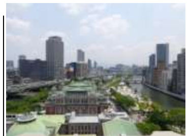
東側の景色(手前から中央公会 堂・中之島バラ園が一望)

大阪の街並みを眺望し、 心がなごむ癒しの時間 を過ごされてはいかが でしょうか。