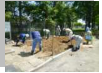
▲ おっちゃん パワー全開!!

今後「学習園」は、子どもたちが、花と緑の大切さを学べる場所として活用される予定です。