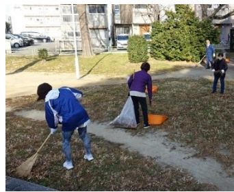
落ち葉が多くて大変

公園です。愛護会では、公園をきれいに保ちたいという思いから、日々の清掃活動に加え、毎月第3日曜日には町会と連携し、トイレも含めた一斉清掃を実施するなど、公園全体の美化活動を積極的に取り組んでいます。