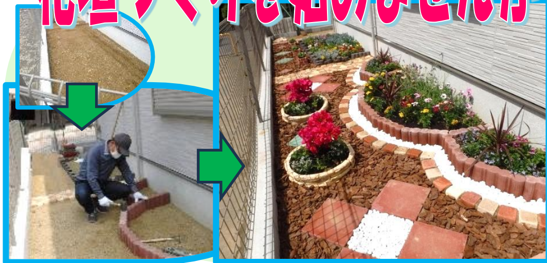
何もないところから大変身

建設局では、住民のみなさんによる花と緑のまちづくりを支援するため、緑化ボランティアと連携した取り組み「地域の花壇づくり支