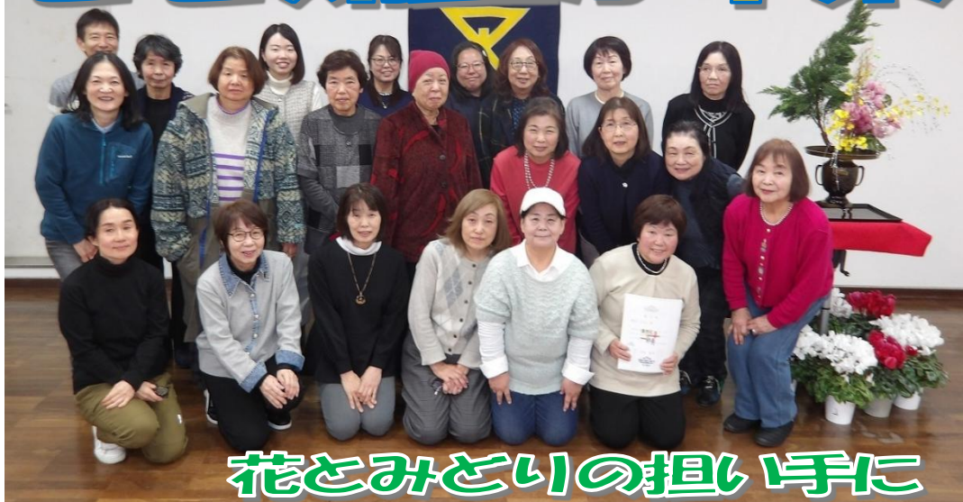
卒業した22期生のみなさん