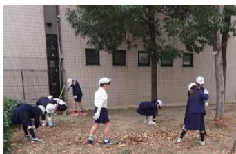
みんなで清掃楽しいな

福島区の玉川南公園で、愛護会・玉川女性会の地域の方々と、玉川小学校3年生と一緒に、