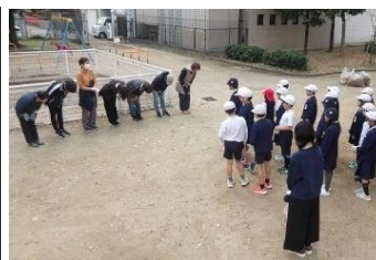
照れくさいけどうれしい

また、講習会の講師などで、ご活躍の際には、その様子を広報紙「ひふみ」で紹介できることを楽しみにしています。