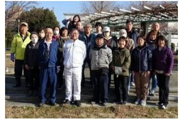
愛護会と町会のみなさん

都島区の毛馬中央公園は、お年寄りから子どもまで、幅広い世代の方々が利用されている