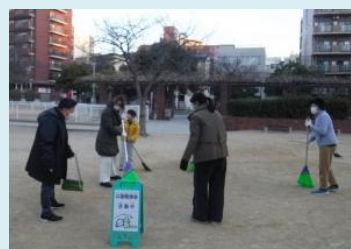
地域一丸となって清掃

ンなど大阪市の事業も活用しながら、公園を中心に子どもたちの笑顔があふれ、にぎわう地域をつっていきたい」と決意されています。