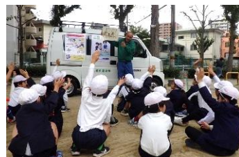
笑顔で答える児童

で行い、元気よく手を挙げ、楽しそうに笑顔で答えるなど、和気あいあいとした雰囲気の中で講習会を終えました。