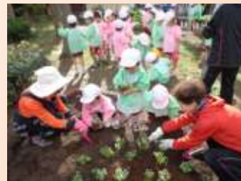
11/11 今津東公園にふれあい花壇設置。園児たちが花苗植え

今では、地域の幼稚園や小学校などと、世代間交流の場としても活用され、公園が花と緑であふれ、憩いと潤いある場所となるように、世代を超えた取り組みとして、市内各所で進められています。