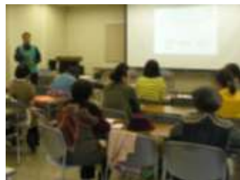
ボランティア活動の紹介