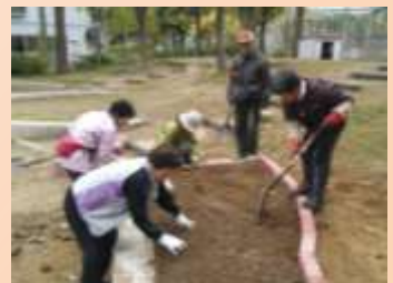
11/20 北江口中央公園にボランティアの皆さんが花壇設置