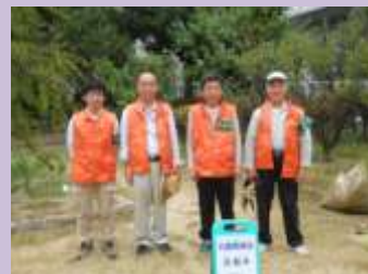
愛護会と町会の皆さん

黒河会長は「これからも地域と連携し、公園が憩いの場として、多くの人が集う公園にしていきたい」と思いを語られました。