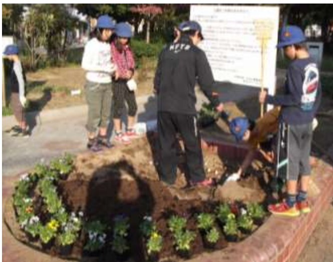
花の植え付けに熱心な三先小学校の児童たち

参加された皆さんは、2か所の花壇に分かれ、チューリップの球根やビオラなどの草花を植