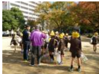
子どもたちとの清掃

公園清掃は、愛護会を中心に、堀江連合振興町会・第十四振興町会をはじめ、地域が一丸となり活動していますが、落葉