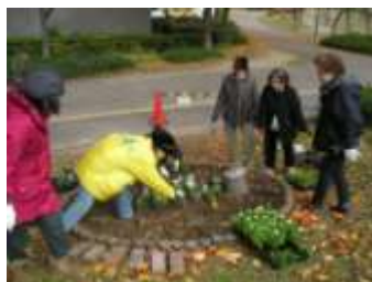
花壇の植え付け方を学ぶ

最終日には「楽しい花壇づくり」と題して扇町公園内の市民協働花壇で草花の植え付けを体験したあと、区役所会議室で閉講式を行い、一人ひとりに修了証が手渡されました。