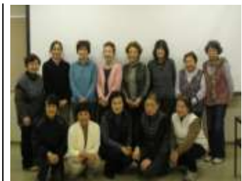
新グリーンサポーターの皆さん

新しくグリーンサポーターになられた皆さんは「大変勉強になり楽しかった」また「植物全体について、いろいろな知識を習得できとてもよかったです」と語ってくれました。