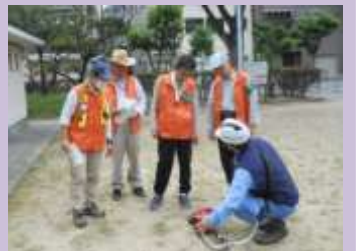
刈払機講習の様子

特に、西九条公園では、3月の下旬に梅が咲き誇り、多くの人で賑わう公園であり、公園の清掃活動においては、町会と協力して取組んでおられます。