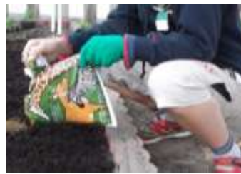
サバンナ堆肥も大活躍

2日目は「植物の基礎」。3日目には「土づくりと肥料」を学び、4日目では「植物の殖し方」と花づくり広場の見学及び草花の寄せ植え