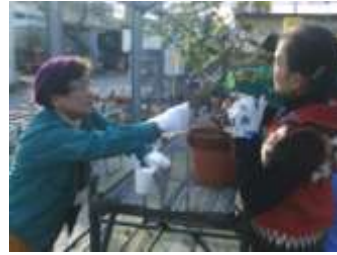
都島区土屋GCに剪定指導

適した土づくり」や「播種の仕方」「菊、菖蒲、アジサイの手入れ方法」など、担当するGCが内容を考え、当日の講師も務