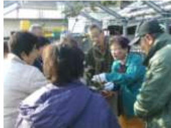
まずは見本剪定で

適した土づくり」や「播種の仕方」「菊、菖蒲、アジサイの手入れ方法」など、担当するGCが内容を考え、当日の講師も務