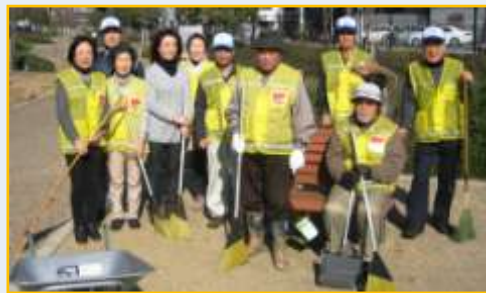
▲ 清掃活動中の難波元町公園愛護会の皆さん。

浪速区の難波元町公園は、地元の要望により、JR大和路線の線路跡を利用して、平成19年にできた公園です。南北に細長い公園は、早朝から散歩に訪れる方など、多くの方に利用されています。