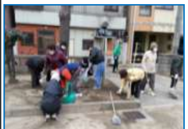
▲ 1月、雪チラつづく中の清掃

まり話をしなかった方と親しく話ができ、仲良くなれるコミュニティーの場となっており、参加者が増えています」と、うれしい悲鳴を上げておられました。