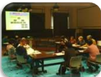
(真剣に聞き入る参加者の皆さん)