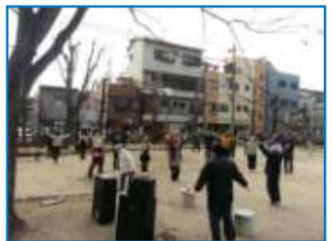
▲ まずは、ラジオ体操!

こうした美化活動の成果が認められ、平成25年11月21日に、浪速区長から表彰を受けました。