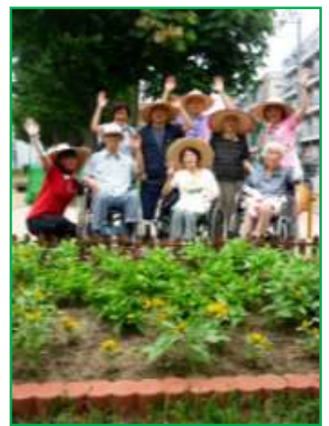
▲ 夏のふれあい花壇の様子

各愛護会(西成区51組織、浪速区20組織、住之江区45組織)は、公園の美化保全活動を進めると共に、その地域ならではの取り組みを進めています。今回は、様々な活動を進めている公園愛護会をご紹介します。