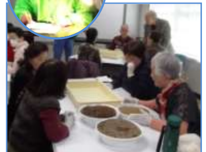
土づくりの実践を行う参加者たち